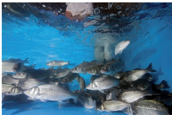
Photo sources: Erwin Sander Elektroapparatebau GmbH - www.photocase.com Stand: 03/2010

Für eine schmackhafte Produktqualität ist glasklares Wasser erforderlich.